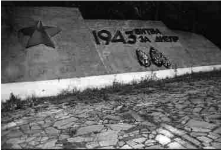
Пам'ятний знак при вході до меморіалу.

декілька разів переходили з одних рук до інших.