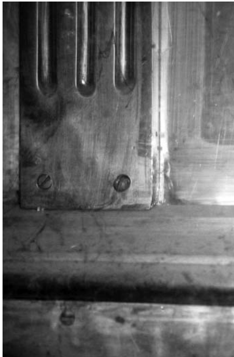
Мал. 4. Накладка «Пілястра» на металевому облаченні престолу Андріївської церкви (фрагмент).

Звертає на себе увагу той факт, що «Божественним проведінням» була надана «трапеза» саме з каменю – матеріалу необхідного для створення престолу «великої» церкви [21]. Ймовірно, матеріал престолу 1753 р. («мрамор») також