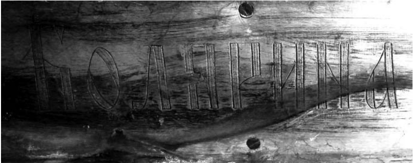
Мал. 14. Напис на п'єдесталі престолу Андріївської церкви (фрагмент).