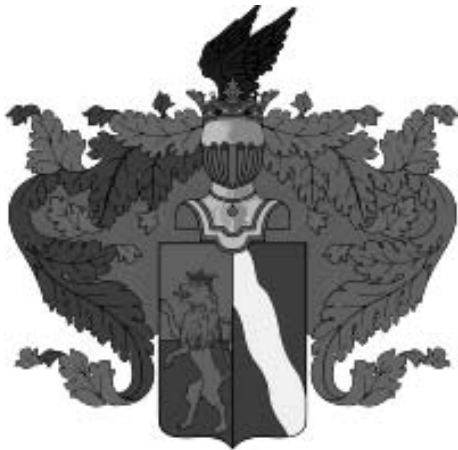
Мал. 15. Герб дворянського роду Свечіних.

У XVIII ст. «форма боярин преимущественно сохраняется в церковном употреблении в поминании покойных дворян» [86]. Слово «боярин» зберегло свою епітафійну функцію відносно дворян і в XIX ст., на що вказують як речові, так і писемні джерела. Так, у притворі церкви Тихвинської ікони Божої Матері в Добриничах (на