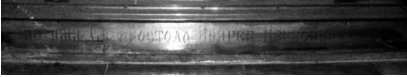
Мал. 6. Напис на п'єдесталі престолу Андріївської церкви (фрагмент).

Андреевской церкви» (1899 р.) [30], яка проливає світло на історію виготовлення облачення престолу: дозволяє встановити ініціаторів його створення, матеріали і майстра, що виготовив цей яскравий зразок художньої обробки металу кінця XIX ст.