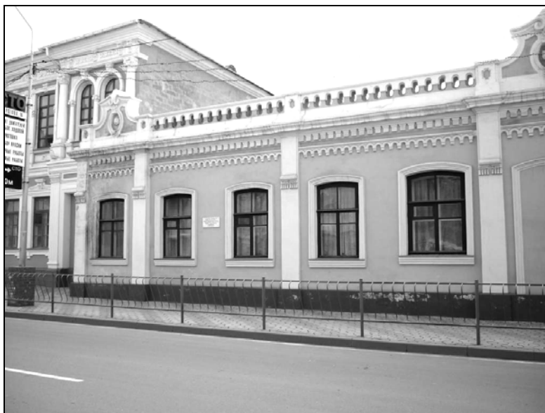
Рис. 1. Место, где располагался дом П. Дюбрюкса. Современный вид.