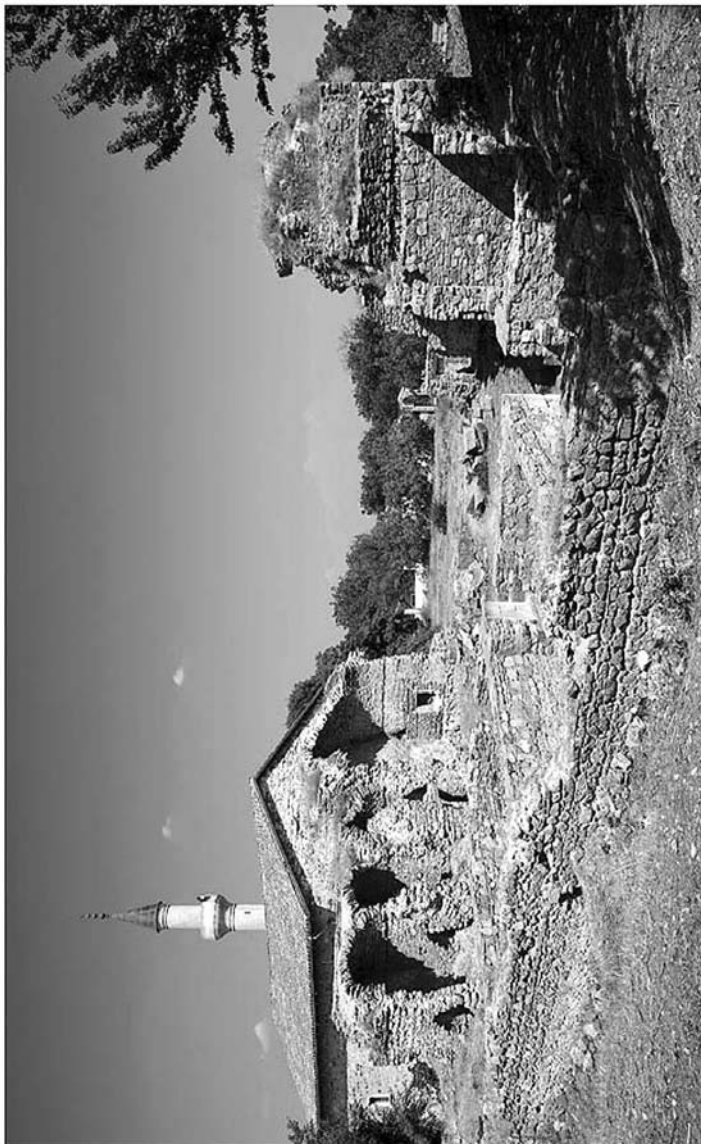
Рис. 2. г. Старый Крым. Памятник архитектуры и градостроительства № 276-Н мечеть Узбека и медресе. Современное состояние.