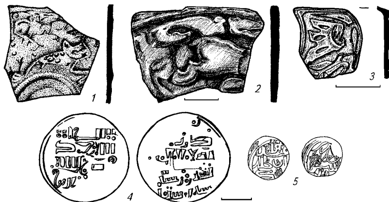
Рис. 3. Окремі знахідки і монети з лівобережжя Псла та Дніпра. Уламки дзеркал: 1 – с. Давидівка; 2 – с. Шевченки; накладна деталь піхв: 3 – ур. Шведівка поблизу Комсомольська; монети: 4 – с. Карпівка; 5 – с. Дмитрівка. Матеріал: 1–2 – олов'яниста бронза; 3, 5 – срібло; 4 – мідь.

Натомість з ур. Павлівка на південь від Келеберди і решток затопленого водосховищем золотоординського поселення [1, с. 69–72] походить ціла група вже кілька разів опублікованих і досить виразних матеріалів, що позначають місце стійбища кочівників золотоординського часу [16, с. 76–77, рис. 1: 1; 29, с. 79–82].