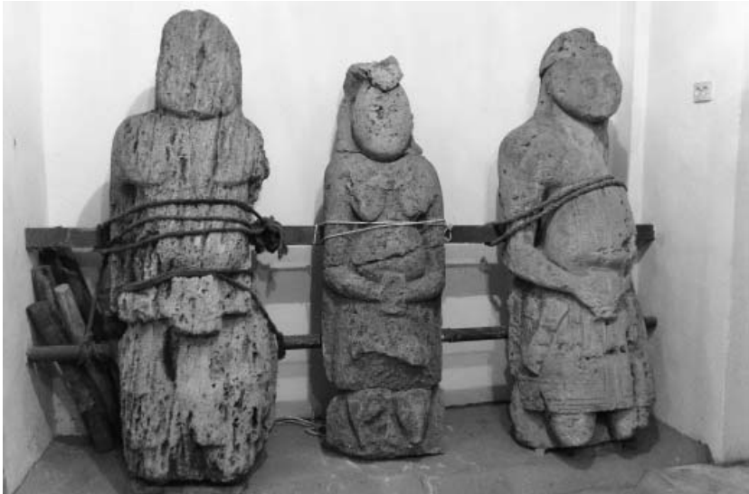
Фото 4. Половецькі скульптури в другому залі Лапідарію. Праворуч – дарунок великого князя Миколи Михайловича з його Рогачицької економії