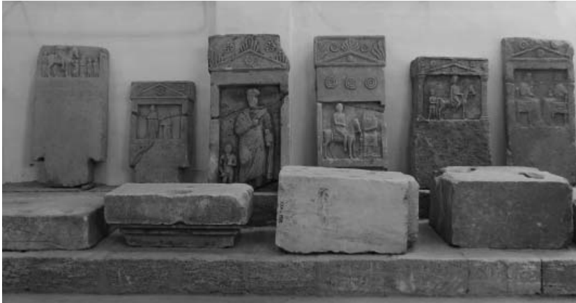
Фото 3. Античні пам'ятки в першому залі Лапідарію. Більшість з них потрапила до Херсонського музею з колекції І. К. Суручана

На жаль, Музеєм втрачено дореволюційну документацію цієї колекції. Проте встановлено, що в її складі були насамперед лапідарні пам'ятки, а також інші речі античного часу – черепиця, глиняні грузила тощо. Зараз у ХОКМ готується до друку каталог «Повсякденні речі античного світу», на сторінках якого належне їм місце посядуть і предмети з колекції І.К. Суручана.