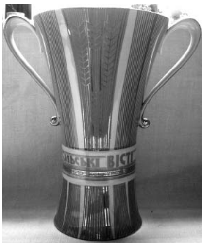
Віцько І. М. Ваза «Сільські вісті», прикрашена деколлю з золотом. 1980 р. Полтавський фарфоровий завод.