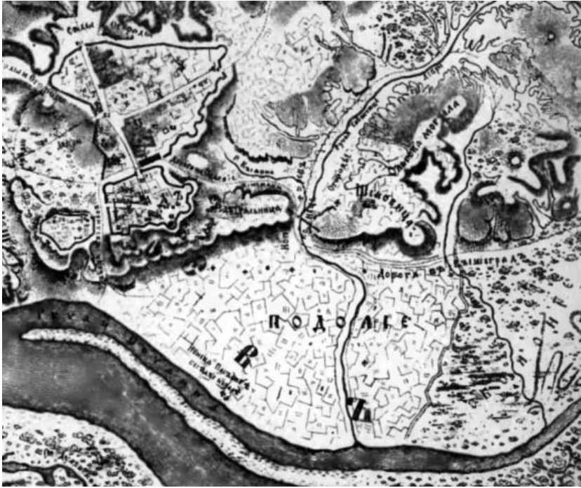
Рис. 2. «План Києва в християнські часи, до руйнування його Батьєм» (Фрагмент) [33]

Наприкінці XV ст. – на початку XVI ст. (бл. 1535 р.) литовський замок кілька разів відбудовувався. Відомо, що під'їзд до нього був з боку Старого Києва, а через нинішній Андріївський узвіз було перекинута «мост з зуводом на ланцюгах двох», який вів до головної брами з високою вежею на ім'я «Драбська» під охороною 10 драбів (з нім. Drabanten – гвардійці під командування ротмістра). У разі небезпеки міст піднімали. По краю схилів замок оточувала висока дерев'яна стіна з перекритою драбиницею з 133-ма окремими дільницями – «городнями», тобто помостами для оборони; з 15-ма дерев'яними триповерховими шести- і чотириохранными вежами, з високими дахами та бійницями – «стрельбами». На одній із веж був особливо цінний «зекгар» (міський годинник) зі всіма приправами, за яким доглядав особливий «зекгармистр».