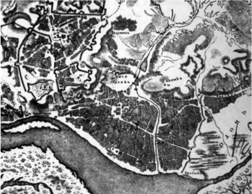
Рис. 5. «План Києва по возоєдиненні его с Россією, до XIX века» (Фрагмент) [36]

Колегіуму, зведення нових оборонних споруд для самих міщан було не під силу. Тільки наближення нової війни з Туреччиною дало поштовх до початку відбудови Старого Києва і посилення захисту Подолу вже державним коштом [19].