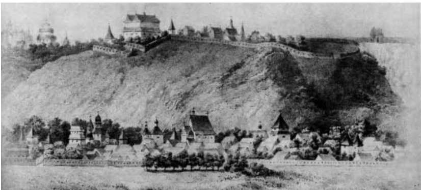
Рис. 3. Замки на Киселівці та Кудрявці, 1651 р. [34]

Головною частиною міста був Поділ, який складався з торгової частини та Біскупщини. Обидві частини мали дерев'яними укріплення з боку Почайни й Оболоні та розмежовувалися канавою, викопаною на місці русла р. Глибочиці. Поділ значно розбудувався під час польського володарювання: на горах Щекавиця та Киселівка здійснювався замок київських воєвод, вдалині – митрополичий двір на Кудрявці, а з південного заходу до замку пролягало Старе місто [14] (див. Рис. 4).