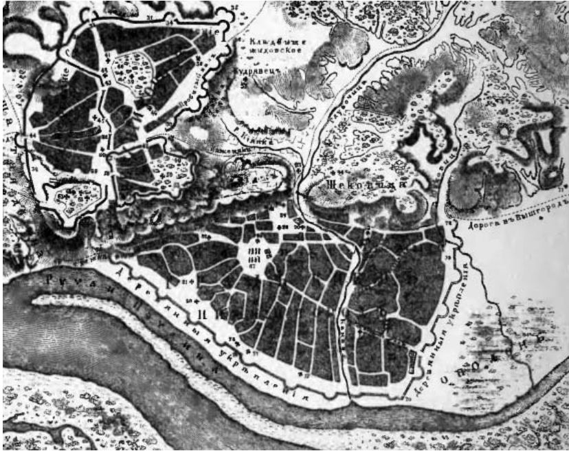
Рис. 4. «План Киева в эпоху иноземного владычества» (Фрагмент) [35]

З переходом управління Києвом до Російського воєводства почалося укріплення Подолу земляними валами. У щоденнику генерала А.А. Гордона, який наглядав за роботами, сказано, що 7 червня 1684 р. почали зводити кріпосний вал Києво-Подолу [15].