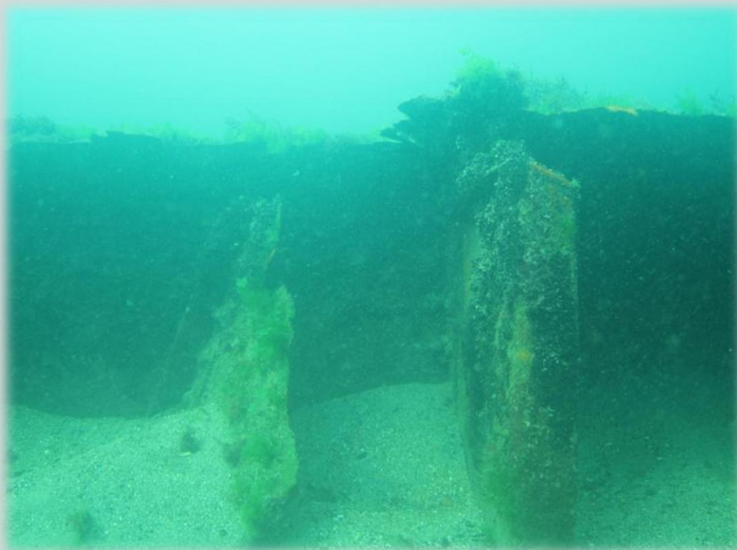
Фото 4. Обломки корпусу судна