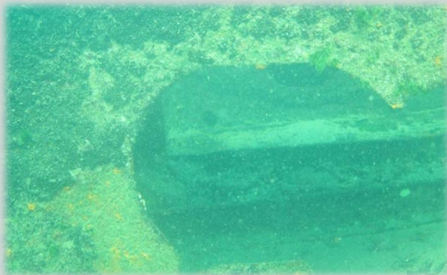
Фото 2. Набор корпуса

Сам я залез на верхушку мыса Ахиллеон, пытаюсь сверху рассмотреть контуры погибших судов. Ребята, вооружившись трубками и масками, начали методично обныривать район поисков. Но, увы, по координатам на лоции ничего не оказалось. Все немного устали, мне пришлось настоятельно попросить ребят обнырять район мористее и правее от координат на лоции. Они сразу наткнулись на обломки достаточно крупного судна.