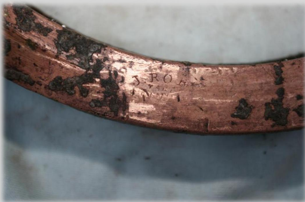
Фото 6. Маркировка на ободі ілюмінатора.

На удивление, рука мародеров (любителей цветного металла) судна не коснулась, даже несмотря на то, что оно лежало на мелководье. Все бронзовые обводы иллюминаторов на месте, также как и медные трубы паропроводов.