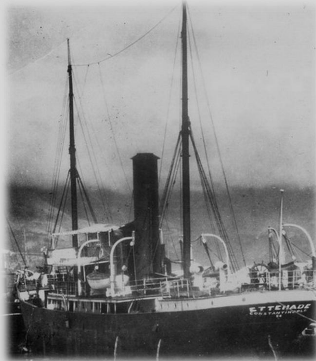
Фото 1. «Пенай» - «Эттехад».

входили канонерская лодка «Дон», транспорт «Красный Флот», самоходная шаланда «Фанагория» с минной баржей, буксир «Никополь» с баржей «Копер», самоходная шаланда «Гардипия», 11 сейнеров. В восточную группу входили транспорт «Пенай» и пять сейнеров.