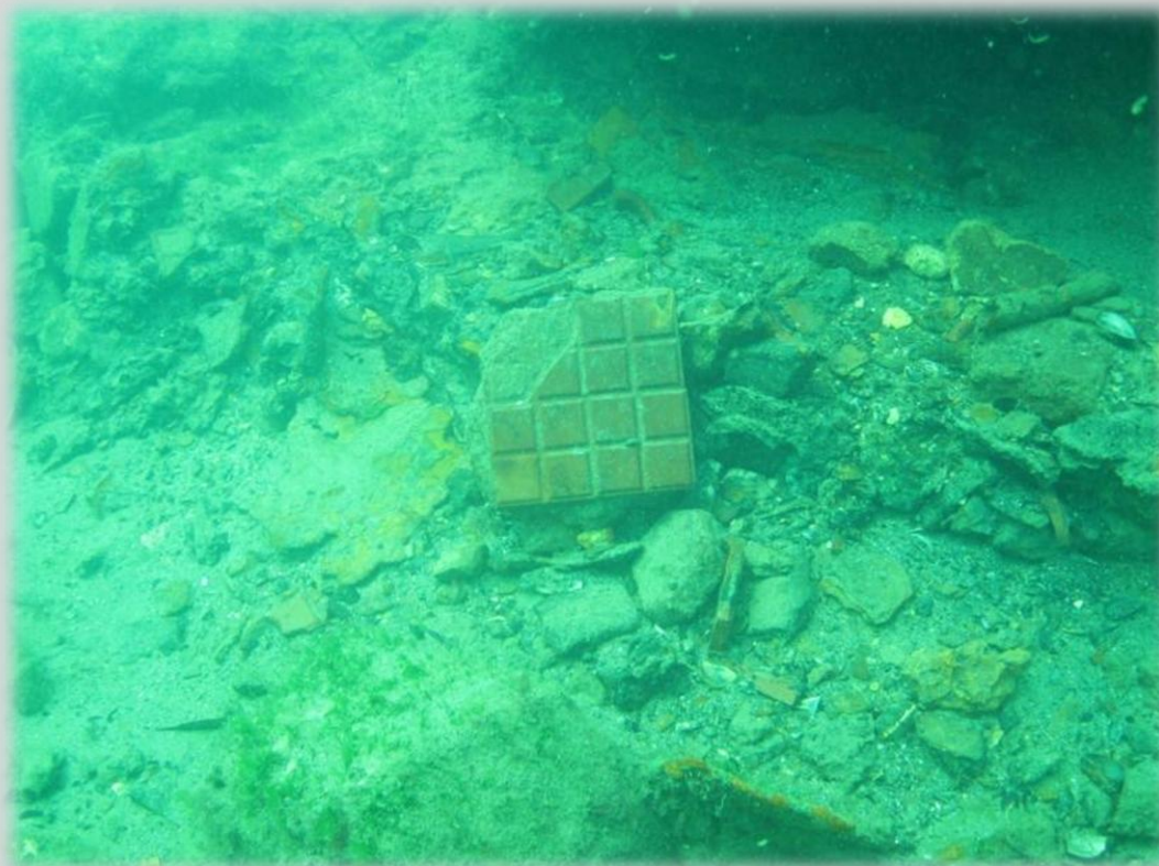
Фото 5. Плитка камбуза