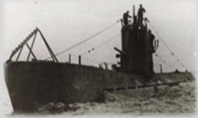
Підводний човен типу „М”.

3 листопада 1941 року біля берегів Румунії внаслідок аварії чи на мінному полі загинув