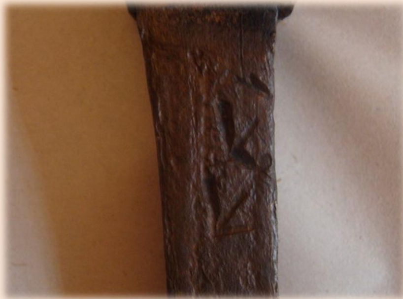
Рис. 10. Клеймо «2 якоря» на медном гвозде.

В качестве балласта использованы кирпичи. Найдены: серебряная чарка с драконом; пуговица – 10 полк линейной пехоты Франции.