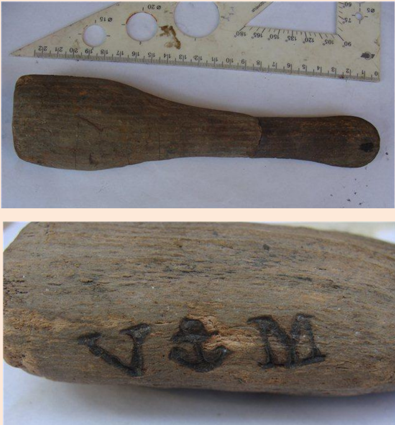
Рис. 12. Деревянная колотушка с клеймом V R.

Фрагменты свинцовой обшивки. Железный, прямоугольной формы бак. На судне наблюдаются следы пожара. Вероятно, это и есть французский линейный 100-пушечный корабль «Генрих IV» (Henri IV).