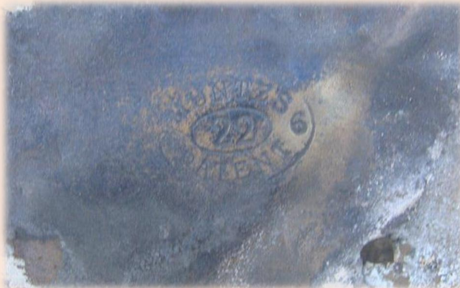
Рис. 4. Обшивочное клеймо MUNTES PATENT 6 22 6.

Из материала преобладает дуб. Один из листов обшивки имел клеймо VIVIANS & SONS. LONDON. Судно лежит кормой к берегу, носом в море.