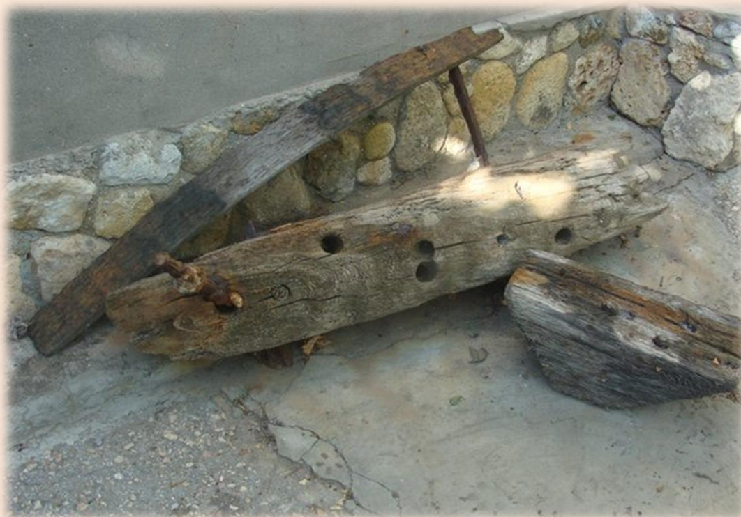
Рис. 1. Выброшенные штормом фрагменты корпуса.

Итак, осенью 1854 года боевые действия Восточной войны перенеслись в Крым. Евпатория была оккупирована 2(14) сентября 1854 года, и в ней сосредоточился 35-тысячный турецкий корпус Омер-паши. В Евпаторийской бухте и порту находилось большое количество кораблей.