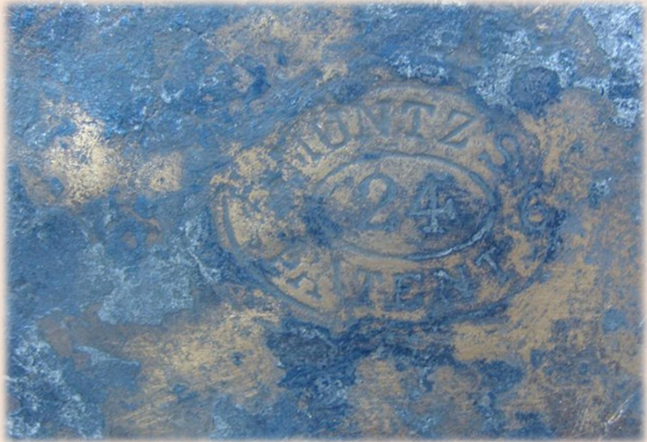
Рис. 6. Обшивочное клеймо MUNTES PATENT 6 24 6.

В носовой части скопление ядер. Обшивка имеет клеймо MUNTES PATENT 6 24 6.