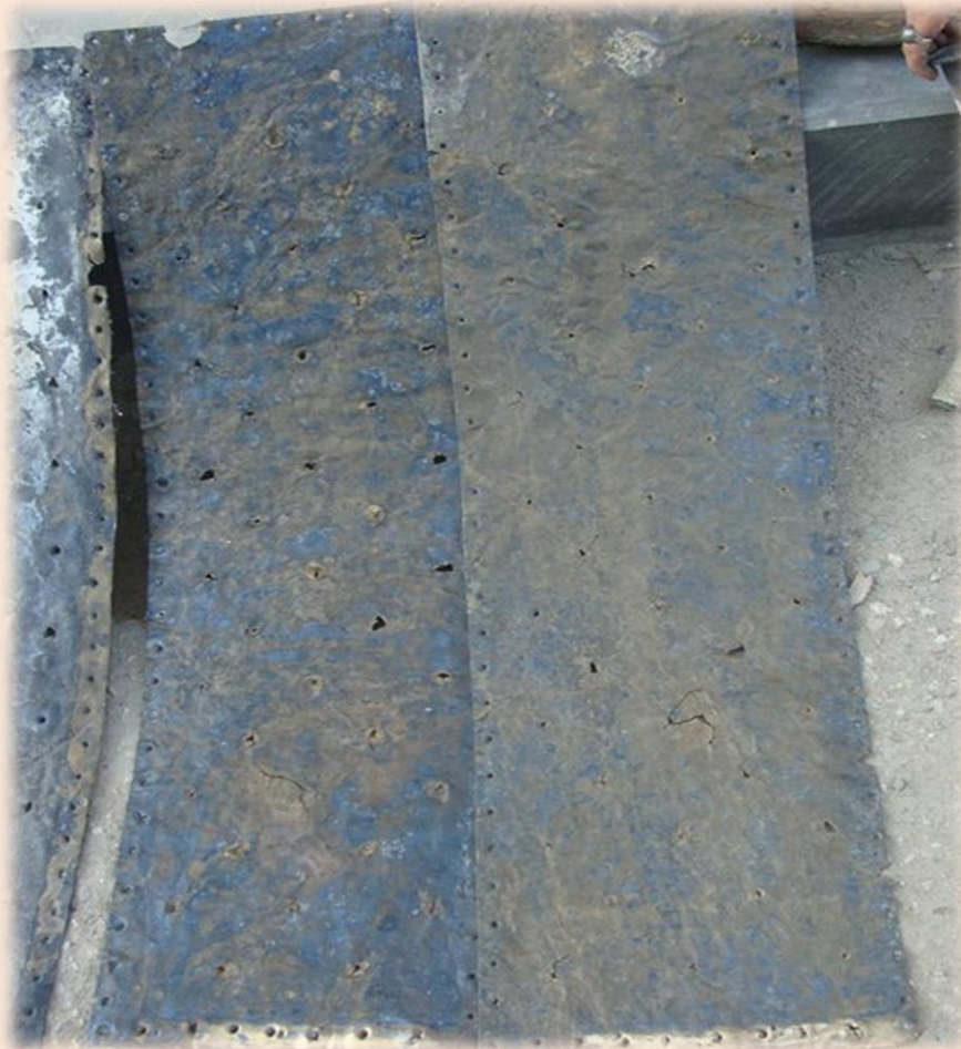
Рис. 3. Листы бронзовой обшивки бортов. Размер 123 см х 36 см.