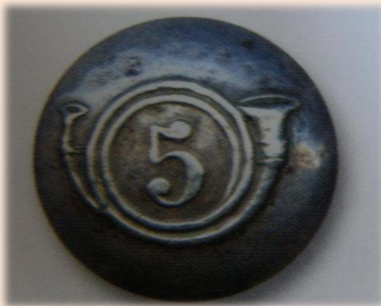
Рис. 11. Пуговица – 5 линейная пехота Франции, на корабле была найдена точно такая же, но с цифрой 10.

В качестве балласта использованы кирпичи. Найдены: серебряная чарка с драконом; пуговица – 10 полк линейной пехоты Франции.