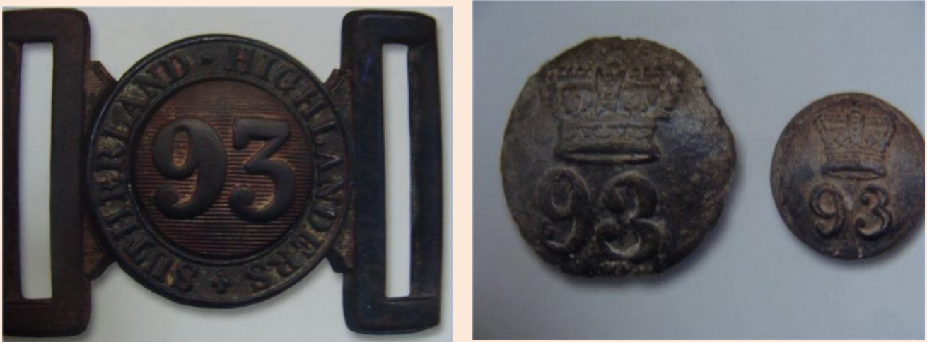
Рис. 5. Английская бронзовая пряжка 93 полка и пуговицы № 93.

Пятое судно лежит возле моста № 1 Нового пляжа. Каркас судна в хорошем состоянии. Материал: сосна, дуб, но была найдена балка красного дерева. Наблюдаются следы сильного пожара, попадают оплавленные гвозди и обшивка, оплавленные английские бутылки, все покрывает слой гари. Обнаружена английская бронзовая пряжка 93 полка и пуговицы № 93.