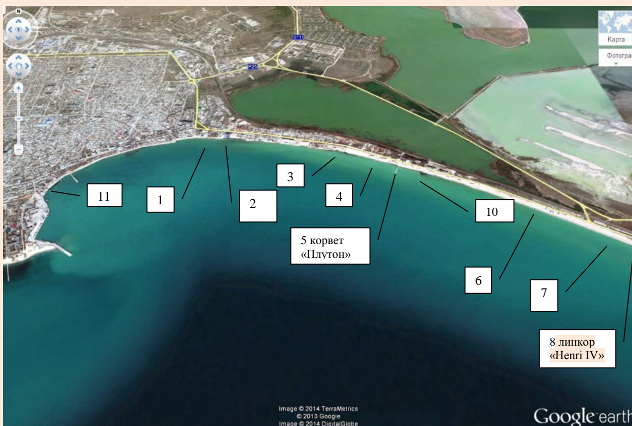
Рис. 2. Локализация затонувших судов у Евпатории.

время ловли крабов, рапанов и мидий, а также прогулок по берегу моря после сильных штормов. Все находки имеют случайный характер, и можно только догадываться, что находится там... глубоко в песке. Все корабли находятся на удалении 50-150 метров от берега, на глубине от 3 до 8 метров. Останки кораблей почти полностью ушли в песок. И только изредка, раз в несколько лет, меняющийся рельеф морского дна обнажает их достаточно сильно.