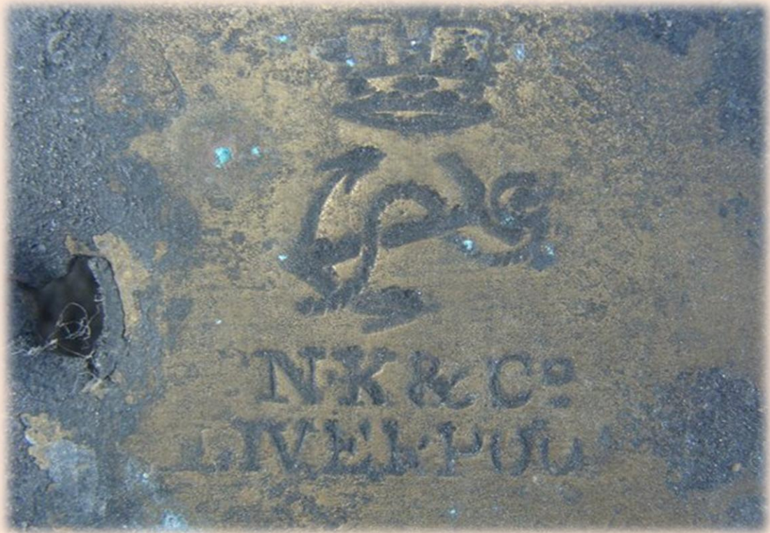
Рис. 9. Обшивочное клеймо NK & Co LIVERPOOL

Недалеко от него находится седьмое судно . В верхней части его корпуса были использованы Г-образные железные конструкции. Найдены бронзовые костыли. Борта обшиты листами бронзы. Обнаружена свинцовая труба. В качестве балласта использовался гранит.