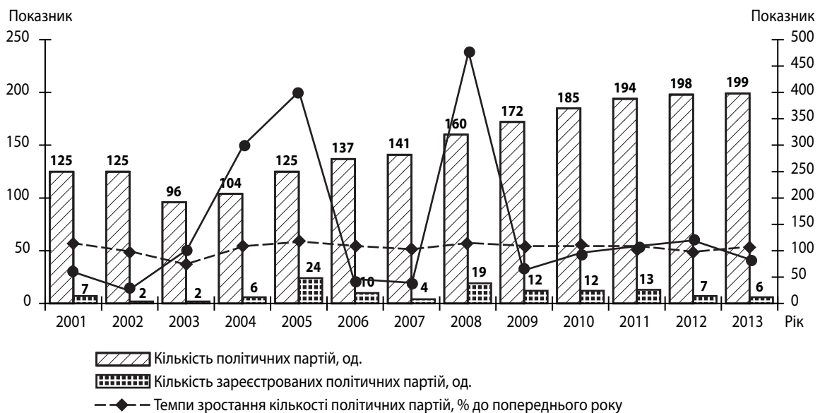
Рис. 1. Динаміка розвитку партійної системи в Україні в 2001 – 2013 рр.

часткове перезавантаження влади, перебудову її діяльності у форматі «про-» та «антипрезидентських» коаліцій і продовження реформування політичної системи. Так, у 2000 – 2013 рр. кількість партій збільшилася в 1,83 рази, в середньому за рік реєстрували 9 – 10 партій, причому інтенсифікація цього процесу відбувалася за і в рік виборів (рис. 1).