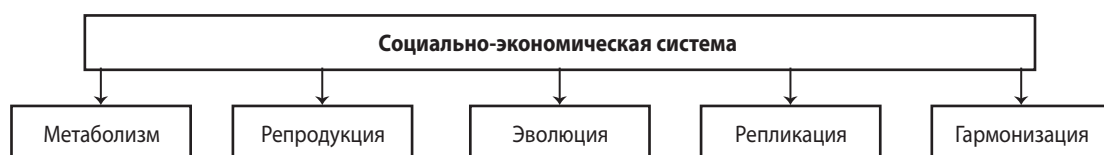
Рис. 1. Процессы, характеризующие функционирование социально-экономической системы

Функционирование социально-экономической системы характеризуют пять основных процессов (рис. 1): метаболизм – трансформация входных потоков в выходные; репродукция – воссоздание, сохранение и улучшение характеристик состояния системы; эволюция – изменение характеристик системы на основе механизмов самоорганизации; гармонизация внутреннего пространства системы, то есть обеспечение внутреннего единства, согласованного функционирования и развития внутренних подсистем с учетом внешних факторов; репликация – порождения подобных себе систем [12].