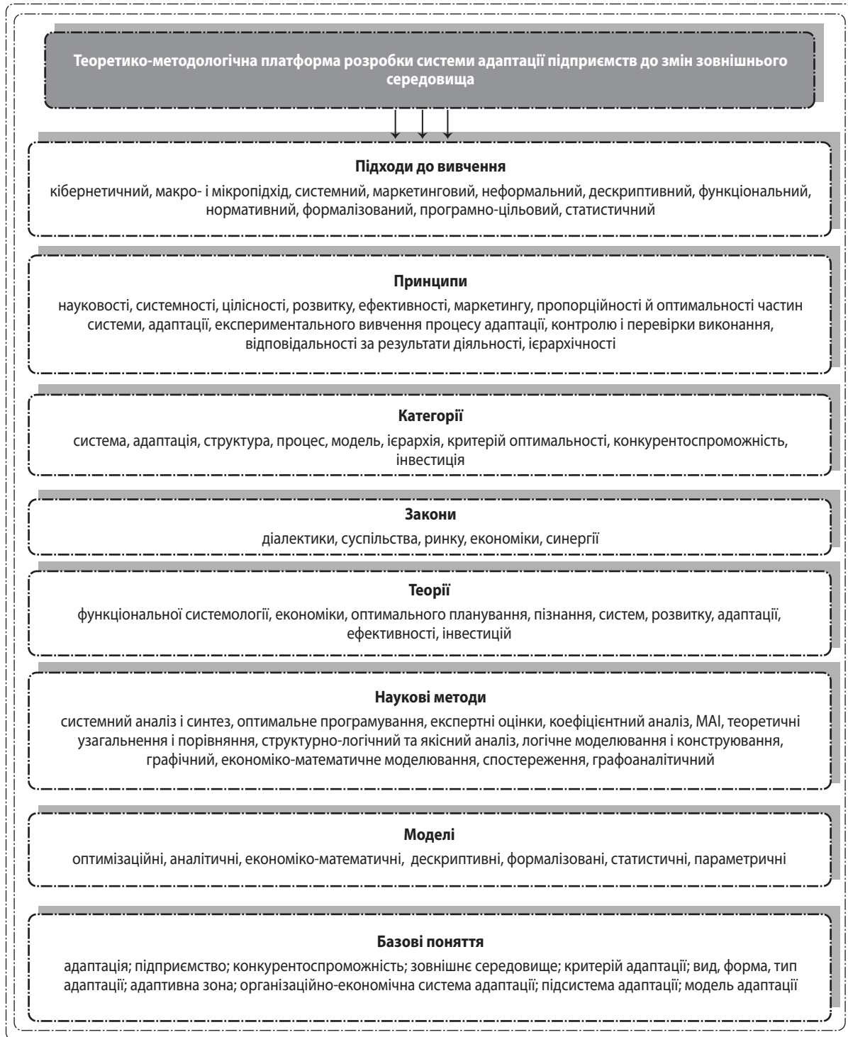
Рис. 2. Теоретико-методологічна платформа розробки системи адаптації підприємств до змін зовнішнього середовища