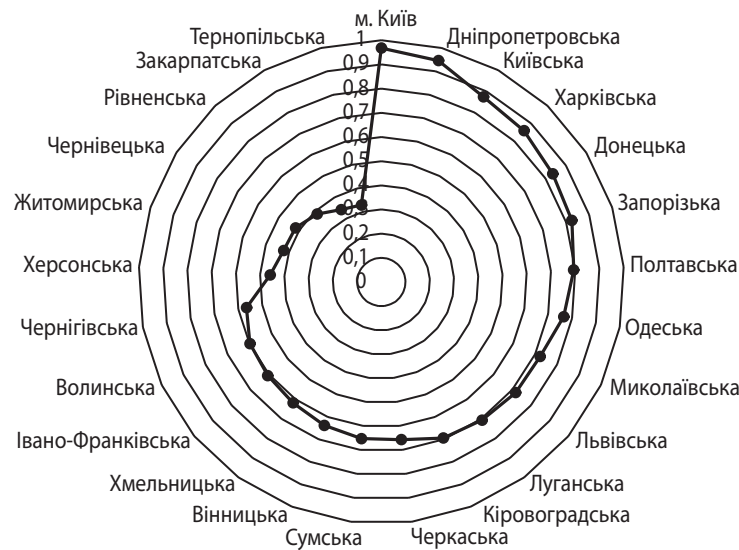
Рис. 2. Інтегральний індикатор фінансово-економічної безпеки регіонів України за 2016 р.

Погіршили стан фінансово-економічної безпеки такі регіони: Дніпропетровська (-1), Запорізька (-3), Луганська (-2), Рівненська (-2), Хмельницька (-4 – найбільший рівень погіршення рівня фінансово-економічної безпеки) області.