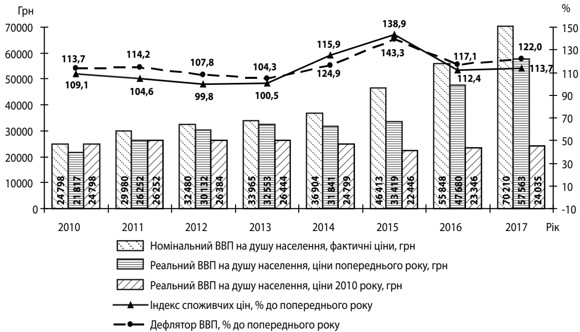
Рис. 2. Динаміка номінального і реального ВВП в розрахунку на душу населення та коливання цінних індексів в Україні протягом 2010–2017 рр. (без урахування тимчасово окупованої території АРК і частини Донецької і Луганської областей в зоні проведення АТО)