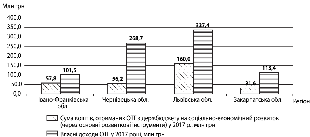
Рис. 3. Обсяг державної фінансової підтримки соціально-економічного розвитку ОТГ та обсягу власних доходів ОТГ у 2017 році, млн грн