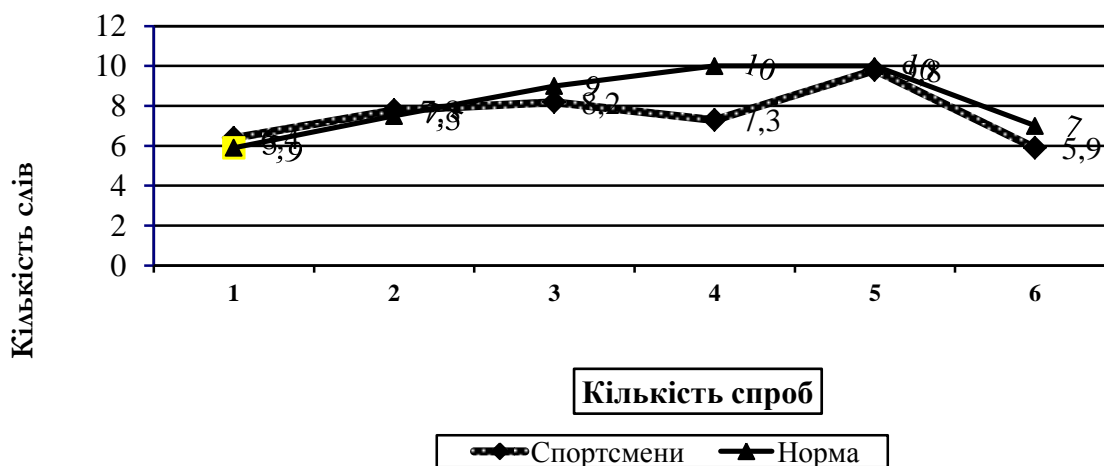
Рисунок 2. «Динаміка процесу вербального запам'ятовування» спортсменів (за результатами методики «Запам'ятовування 10 слів»)

Як показано на Рис.2, «криві запам'ятовування» обстежуваних боксерів, мають характер поступово висхідних ліній. З кожним наступним відтворенням кількість правильно названих слів збільшується (5,9; 7,5; 8,2; 7,3; 9,8). У нормі, 10 слів повинно бути відтворено за 3 повтори. За результатами нашого дослідження, 52 % обстежених спортсменів повторили 10 слів вже після другого пред'явлення, ще 19 % випробовуваних запам'ятали весь ряд після третьої спроби, іншим вдалося відтворити весь ряд тільки після 4-5 спроб. Відстрочене відтворення склало 5,9 слів.