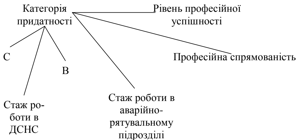
Рис. 1 – Кореляційна структура компонентів, що визначають категорію придатності фахівця аварійно-рятувального підрозділу до дій в екстремальній ситуації

характеризує рівень емоційної стійкості особистості. Також було виділено позитивний, помірний за силою, кореляційний зв'язок з фактором «В» ( r=0,35, p \leq 0,05 ), який свідчить про інтелектуальні особливості фахівця.