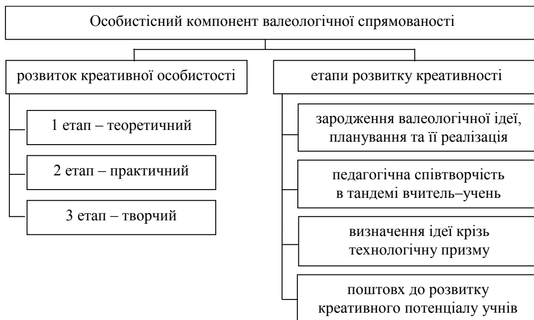
Рис. 2. Структура особистісного компонента валеологічної спрямованості майбутніх фахівців фізичного виховання

готовки, володіння сучасними методиками навчання валеологічної діяльності, наявність валеологічного досвіду тощо. Майбутній фахівець у своїй роботі визначає валеологічну спрямованість у трьох ракурсах: спочатку з точки зору розуміння, засвоєння валеологічної культури й діяльності (як об'єкт валеологічного впливу), згодом у процесі життєдіяльності він вивчає своє середовище крізь призму валеологічної діяльності та прищеплює своєму оточенню валеологічні навички, використовуючи при цьому свою креативність. Структуру особистісного компонента подано на рис. 2.