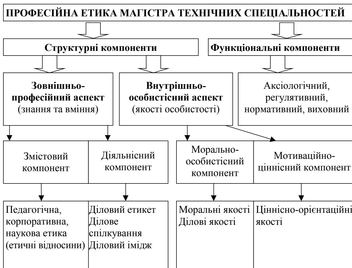
Рис. 2. Сутність професійної етики магістрів технічних спеціальностей

Отже, проаналізована нами багатоплановість і багатофункціональність професійної діяльності магістрів технічних спеціальностей, розмаїття напрямів моральних відносин, пов'язаних із професійною діяльністю магістрів, а також висока ступінь відповідальності, яку несуть магістри технічних спеціальностей говорить про вагоме місце професійної етики магістрів технічних спеціальностей у їх професійній підготовці.