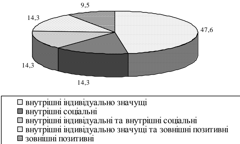
Рис. 1. Розподіл мотивів професійного вибору у майбутніх психологів

Однаковою мірою представлені у досліджуваній вибірці внутрішні соціальні мотиви (14,3%) та дві групи, мотиваційні тенденції в яких розподілені однаково: 1) внутрішні індивідуально значущі та внутрішні соціальні (14,3%) і 2) внутрішні індивідуально значущі та зовнішні позитивні (14,3%). Цей факт вказує на складність та багатоаспектність мотиваційної складової професійного вибору, коли уявлення про професію відображає як бачення себе в ній, так і реалізацію професійних функцій, що особливо важливо для організації психологічної допомоги клієнтам.