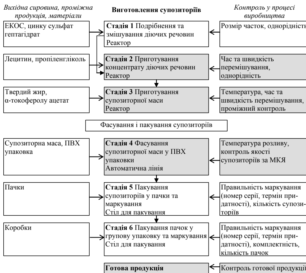
Рис. 3. Технологічна схема приготування супозиторіїв «Трецивіт-прост».

Технологічну схему виробництва супозиторіїв наведено на рисунку 3.