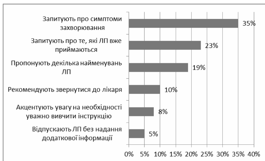
Рис. 1. Питання, які ставлять провізори під час відпуску ЛЗ.

З метою виявлення спонтанного рівня сприйняття реклами фахівцям було запропоновано пригадати ЛЗ, рекламу яких вони пам'ятають. Після опитування було встановлено, що респонденти запам'ятали сюжет ролика та слогани реклами таких ЛЗ: 35 % – карсилу, 27 % – таміпулу, 15 % – мотиліуму, 8 % – лазолвану, 7 % – солпадеїну, 5 % – мезиму, 3 % – нурофену (рис. 2). Вивчення результатів рекламування дає