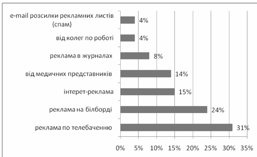
Рис. 3. Джерела, з яких провізори дізнаються про ЛЗ, що поповнюють фармацевтичний ринок.