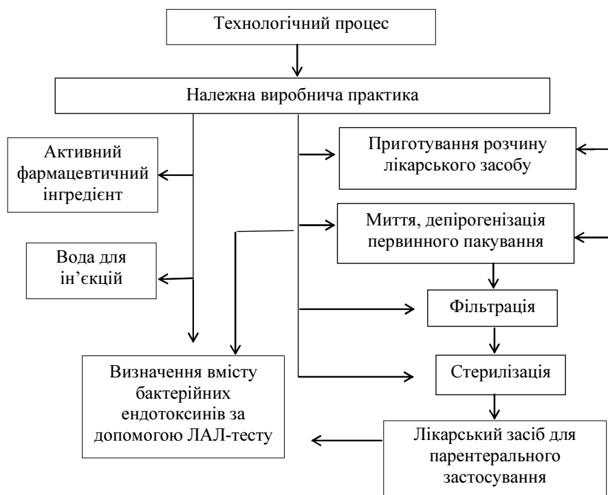
Рис. 2. Блок-схема оптимізації технологічного процесу ЛЗ для парентерального застосування з метою мінімізації вмісту БЕ.

Основною умовою цього процесу є контроль вмісту БЕ на етапі вхідного контролю для АФІ, ВДІ у рутинному контролі, контроль БЕ на всіх стадіях виробництва при валідації, а також контроль стерильного ЛЗ у первинному пакуванні.