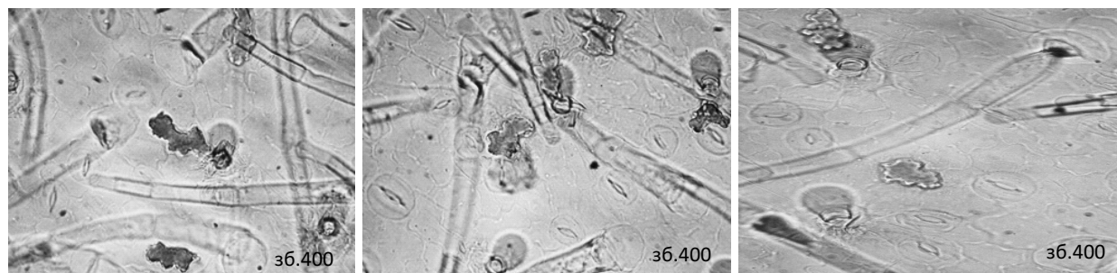
Рис. 4. Локалізація слизу у висушених листках первоцвіту весняного (у клітинах епідермісу) за результатами гістохімічної реакції з 5 % розчином натрію гідроксиду.