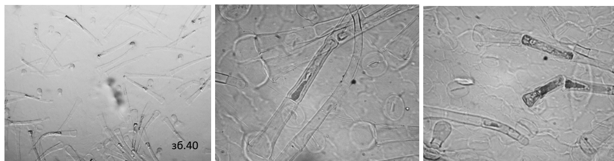
Рис. 5. Локалізація слизу в висушених листках первоцвіту весняного (у другій клітині ніжки трихоми) за результатами гістохімічної реакції з 5 % розчином натрію гідроксиду.