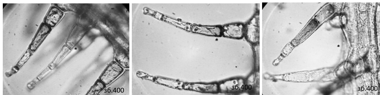
Рис. 2. Локалізація слизу у висушених листках первоцвіту весняного (в другій клітині ніжки трихоми) за результатами гістохімічної реакції з спиртовим розчином метиленового синього (1:5000).