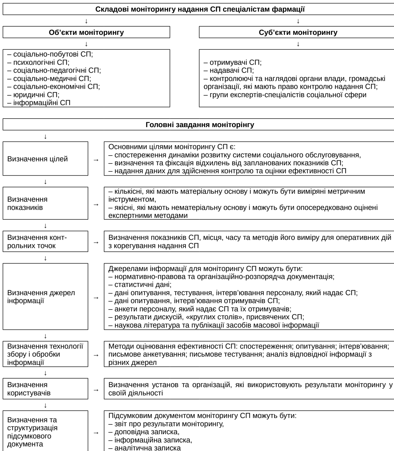
Рис. 2. Алгоритм моніторингу надання СП спеціалістам фармації.

чатку і до такої складової контролю, як «визначення підсумкового документа», зокрема, організаційно-розпорядчого документа. Так, у громадської чи благодійної організації немає права втручатись у діяльність надавача СП спеціалістам фармації, але вони мають право знати, які заходи були прийняті за ре-