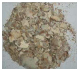
Подрібнена біомаса F. velutipes (тривалість подрібнення – 5 с)