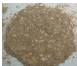
Подрібнена біомаса F. velutipes (тривалість подрібнення – 25 с)