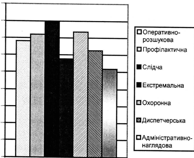
Рисунок 1 - Оцінка важкості праці основних видів діяльності ОВС

- враховувати особливості різних видів праці при підготовці і розстановці кадрів, проводити атестацію робочих місць.