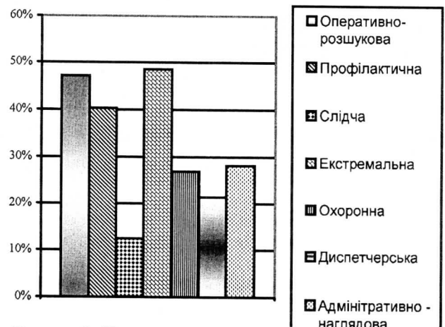
Рисунок 2 - Частота виконання завдань в умовах підвищеного ризику для життя

7. Слідча діяльність (12,35 %) - (рис.2).