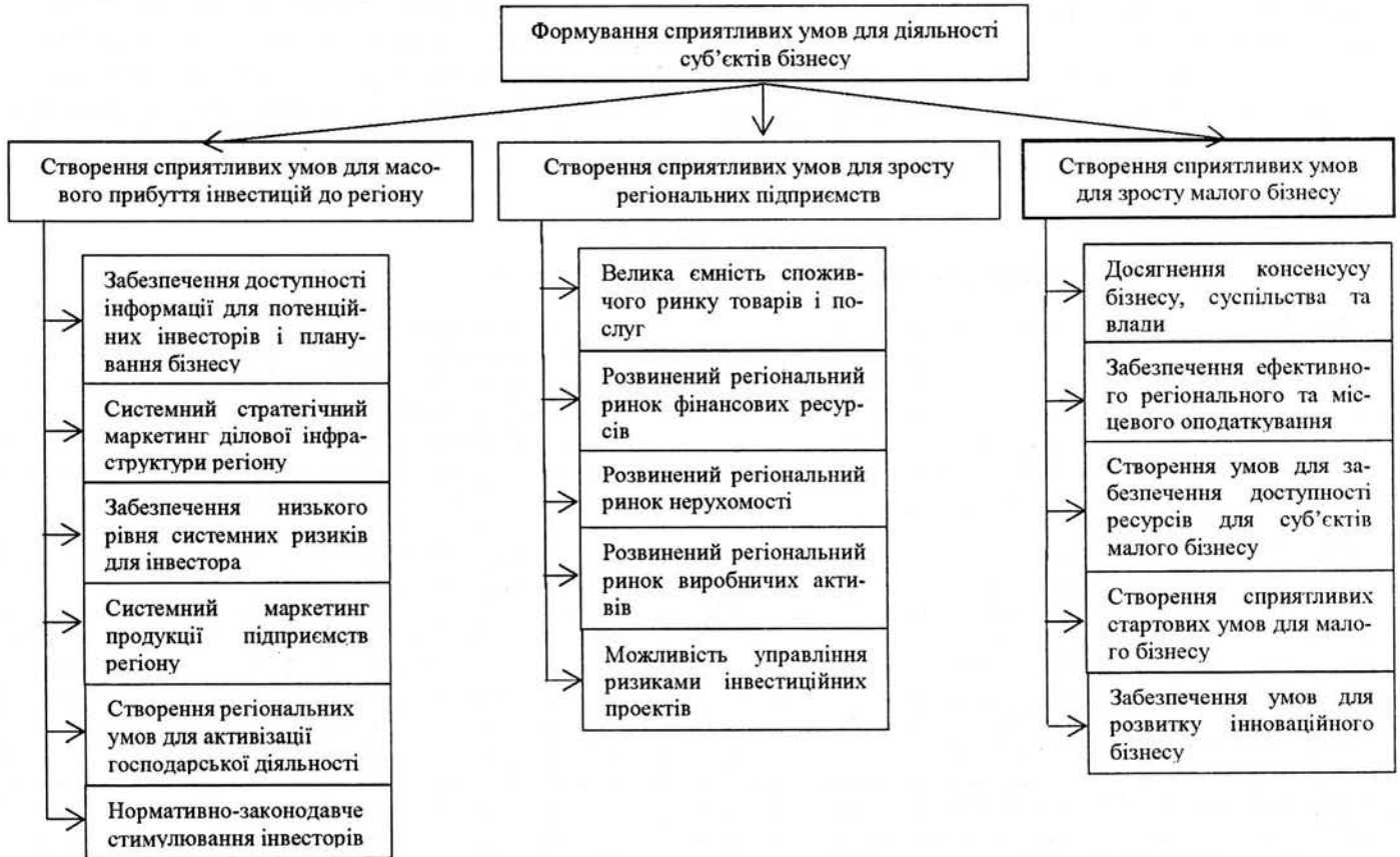
Рисунок 2 - Цільова комплексна програма моніторингу інституціональної інфраструктури підприємництва у регіоні

цивілізаційних та традиційних цінностей. На початку нового тисячоліття перед країною стоїть надзвичайно складна і важлива задача – повернути існуючу соціально-економічну напруженість трансформаційних перетворень у енергію творення ефективної, конкурентоспроможної економіки, транспарентного державного управління та господарювання.