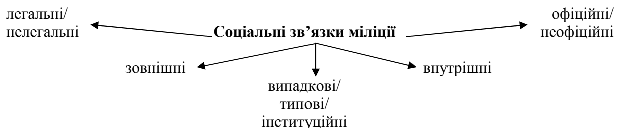
Рис. 1. Класифікаційна схема

Соціальний зв'язок, окрім власне дій, включає три «інфраструктурні» елементи: 1) суб'єкти зв'язку; 2) предмет зв'язку, що відбиває момент взаємозалежності суб'єктів (заради чого, власне, встановлюється зв'язок); 3) регулятори відносин, тобто «правила гри». Ці обов'язкові елементи зв'язку можна розглядати як першооснову для подальшої операціоналізації базової категорії, тобто як критерії класифікації самих зв'язків (див. класифікаційну схему на рис. 1).