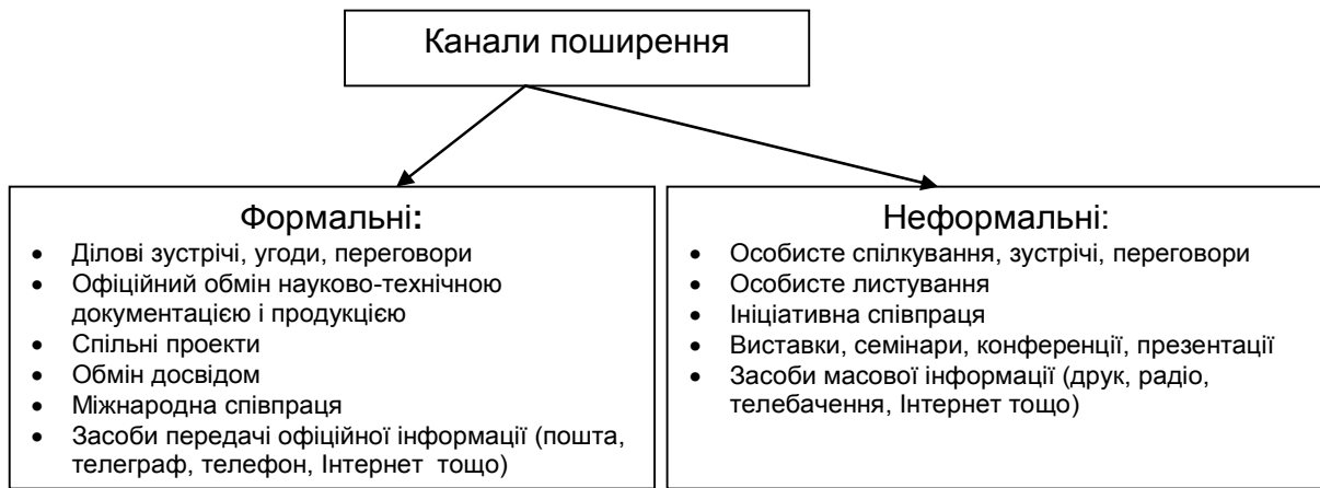
Рис. 2. Витік інформації через комунікативні канали

лення з інформацією суб'єктів, що не мають прав доступу. Воно може виражатися в повідомленні, переданні, пересиланні, копіюванні, розкраданні, публікації та інших формах. Реалізується розголошування за формальними і неформальними каналами поширення (комунікативними каналами) (рис. 2). Основним, але не єдиним носієм інформації (далі – НІ) в такому каналі витоку є фізична особа (людина).