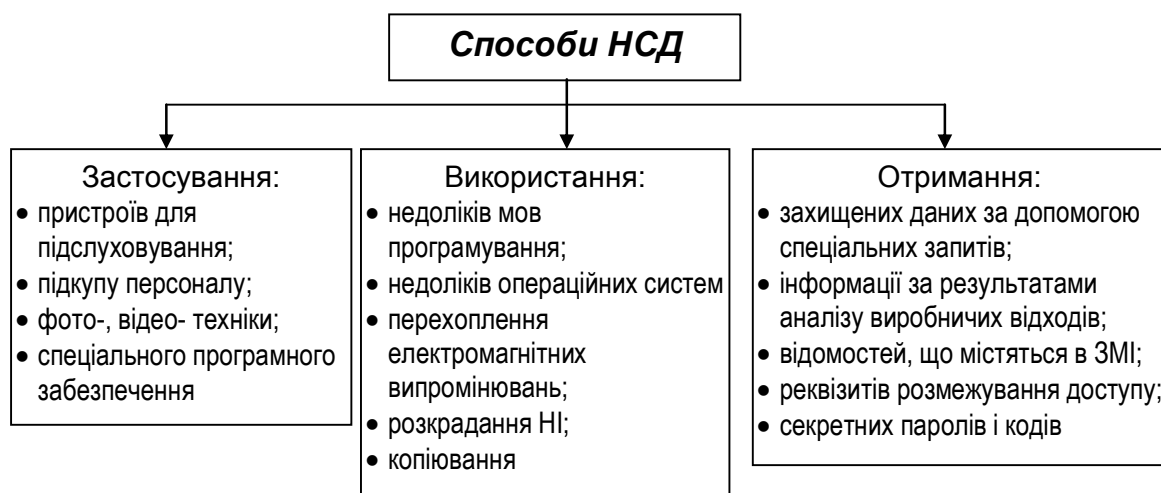
Рис. 4. Можливі способи НСД

Трактування НСД як протиправного навмисного отримання інформації, що захищається, зацікавленим суб'єктом із порушенням установлених правовими документами або власником інформації прав чи правил доступу до інформації, що захищається, є, на наш погляд, дуже «розмитим» і має юридичну спрямованість, що і обумовлює дуже широкий спектр можливих способів НСД (рис. 4) [14]. Усі раніше розглянуті шляхи і канали витоку інформації також підпадають під таке визначення, оскільки в них здійснюється несанкціоноване перенесення інформації до суб'єкта-одержувача.