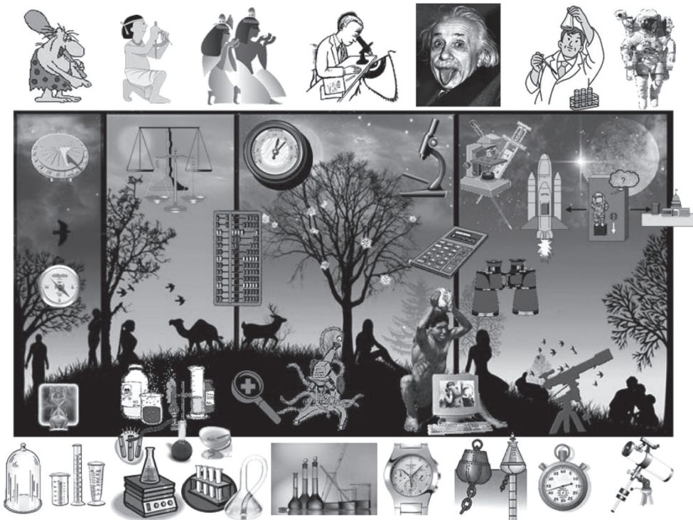
Рис. 1. Совершенствование инструментария в процессе познания окружающего мира

Сегодня аппарат “КСК-БАРС” является своеобразной сложной информационной системой, которая работает или взаимодействует (в процессе диагностики и лечения) с материальными живыми системами (биологическими организмами), и следует отметить, с системами не только высокоорганизованными, но и достаточно интеллектуальными.