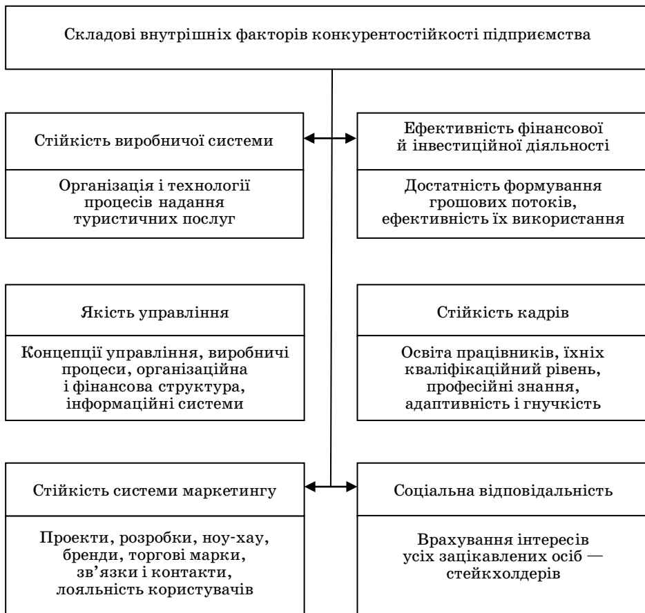
Рис. 1. Структурно-функціональна схема внутрішніх факторів, що впливають на конкурентостійкість підприємства [4; 5]

3) валовий дохід та валові витрати на діяльність підприємства (вартість основних фондів, фонд оплати праці, кількість працівників та обсяг наданих послуг).