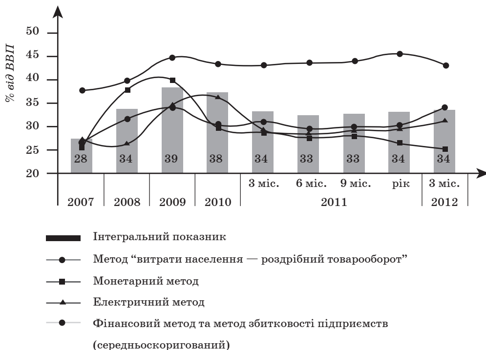
Рис. 1. Динаміка рівня тіньової економіки за різними методами, у % від обсягу ВВП

2010 р. відповідно. Однак у 2011 р. рівень перерозподілу ВВП через зведений бюджет перевищив позначку 30 % на 0,3 одиниці, що свідчить про можливі загрози економічній безпеці країни та прорахунки в бюджетній політиці.