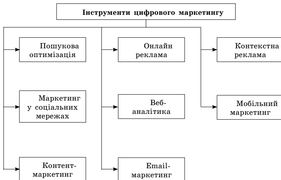
Рис. 1. Інструменти цифрового маркетингу [3]

2. Контент-маркетинг (Content Marketing) передбачає побудову комунікації з потенційними клієнтами завдяки розміщенню спеціалізованої інформації, яка є корисною для цільової аудиторії та асоціюється певним чином з продукцією компанії. Важливе місце при налагодженні комунікацій з цільовою аудиторією з позиції контент-маркетингу займає процес формування орієнтованих цінностей, що притаманні певним сегментам споживачів. Дієвим інструментом у цьому випадку є блог компанії, у якому відбувається комунікація з потенційними клієнтами завдяки оперативному наданню відповідей на актуальні запитання споживачів. Як додаткові засоби можна використовувати поштові розсилки, інформаційні повідомлення різного формату (текстовий, відео, аудіо-та графічний контент) у соціальних мережах, YouTube каналах тощо.