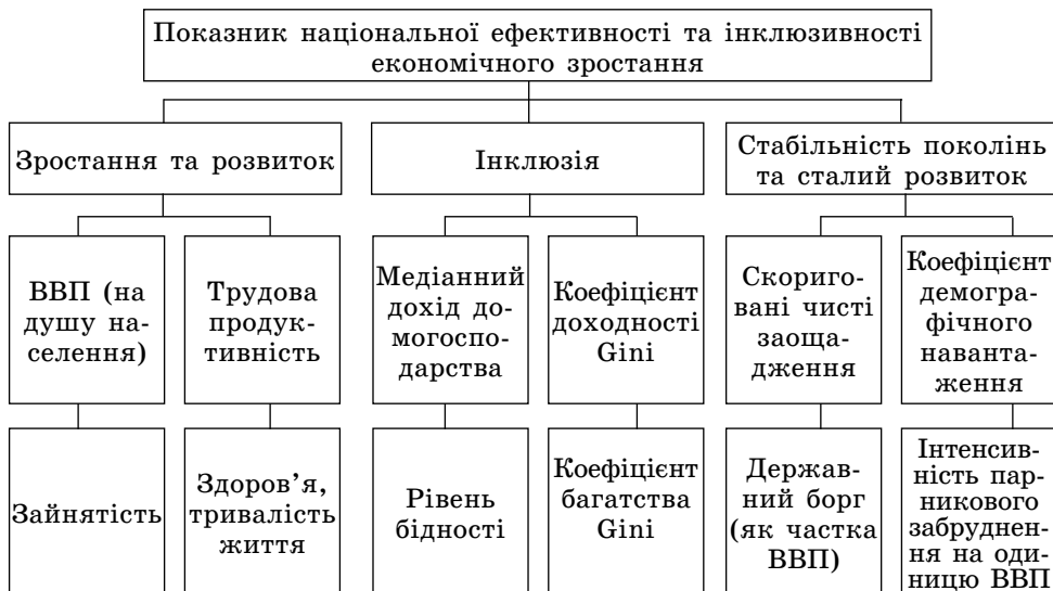
Рис.1. Комплексний показник інклюзивності зростання та розвитку країни [11].

Треба зазначити, що складові показники індексу інклюзивності розвитку економіки розроблені як альтернатива ВВП і більш точноше відображають критерії економічного розвитку країни через призму добробуту людини. Складові показника національної ефективності та інклюзивності економічного зростання країни відображені на рис 1.