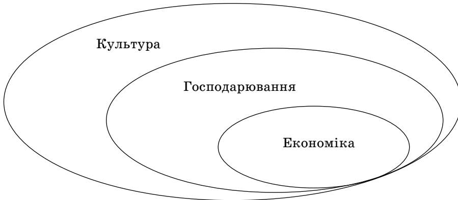
Рис. 1. Господарювання й економіка як елементи культури

Господарювання – діяльність людини, спрямована на забезпечення відтворення власного існування як окремого індивіда та як частини соціуму, відтворення суспільства як єдиного соціального організму. Господарська культура – частина культурної спадщини, яка безпосередньо забезпечує накопичення, збереження, використання та передачу від покоління до покоління найбільш ефективних алгоритмів господарської діяльності, господарювання – форма діяльності, що забезпечує безперервне самовідтворення суспільства як соціального організму. Господарська культура являє собою систему цінностей, смислів, символів, знань, традицій, що забезпечують мотивацію і регуляцію господарської діяльності людини і визначають форму її здійснення, а разом з тим і сприйняття її соціумом [Зарубина, 1998, с. 11].