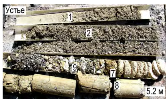
Рис. 3. Общий вид керна по интервалу скважин № 2 и 8: 1 – песок м-з средней плотности; 2 – песо-ракушечни; 3 – песок раковинно-детритовый; 4 – суглинок полутвердый с галькой, гравием и щебнем; 5, 6 – известняк; 7 – песчаник детритовый; 8 – суглинок тяжелый; 9 – галька с обломками известняка.