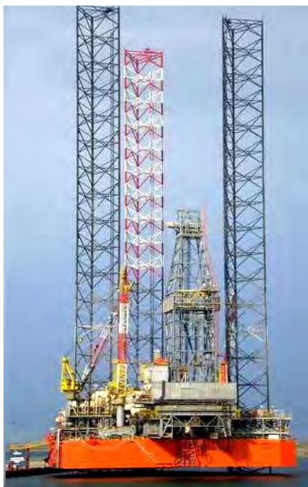
Рис. 1. СПБУ «Петр Годованец» в порту ГАО «Черноморнефтегаз»

Легкие гидроударные установки типа УМБ, созданные в Донецком национальном техническом университете в начале 2000 г, удерживают передовые позиции в отечественной практике бурения инженерно-геологических скважин на морских акваториях. В последнее десятилетие область применения таких установок значительно расширилась. Постоянное совершенствование и практическая реализация технических предложений и технологической схемы бесколлонной многорейсовой проходки скважин обеспечили возможность проведения изысканий установками на глубине до 50 м с борта неспециализированных судов с ограниченным набором оборудования (буровая лебедка, насос, штатная грузовая стрела) [1].