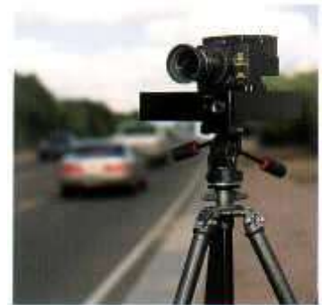
Рис.1. Мобільний фото-радар

Фото-радар (Рис.1), на відміну від традиційного ручного радару, має дві особливості, завдяки яким підвищується його точність що робить майже неможливим уникнення порушниками покарання та виявлення радару до того, як він зафіксує порушення. Такими особливостями є мала потужність та повне покриття шляху на відміну від традиційного радару. Його розташування над дорогою дозволяє реєструвати перевищення швидкості ще до того, як порушник наблизиться до патрульного автомобіля. Більше того, маючи вихідну потужність усього 25 Мвт, він дозволяє вимірювати швидкість транспортного засобу на 5 полосах шляху. Ці дві відмінності призводять до того, що антирадари не встигають визначити фото-радар до того, як порушення зафіксоване. Фото-радари, зазвичай, працюють на частоті 24,15 ГГц. Коли автомобіль проїжджає повз радару, його антена вимірює і посилає сигнал до ЦПУ, який приводить у дію високошвидкісну камеру, що фотографує порушника.