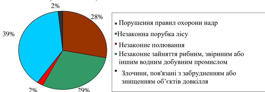
Рис. 2. Структура судимості за злочини проти довкілля у 2007 році (за даними Державної судової адміністрації України)

Аналіз правозастосовної практики дозволяє виявити чітку тенденцію, що була притаманна діяльності правоохоронних органів ще в радянські часи [1, с. 267]: застосовуються норми про відповідальність за злочини, пов’язані з незаконним заволодінням природними ресурсами. Як видно з наведеної діаграми, доля засуджених осіб за злочини, пов’язані із забрудненням або знищенням окремих об’єктів довкілля (забруднення або псування земель, порушення правил охорони вод, знищення або пошкодження лісових масивів, умисне знищення або пошкодження територій, взятих під охорону держави, та об’єктів природно-заповідного фонду, безгосподарське використання земель) становить 1,6 %.