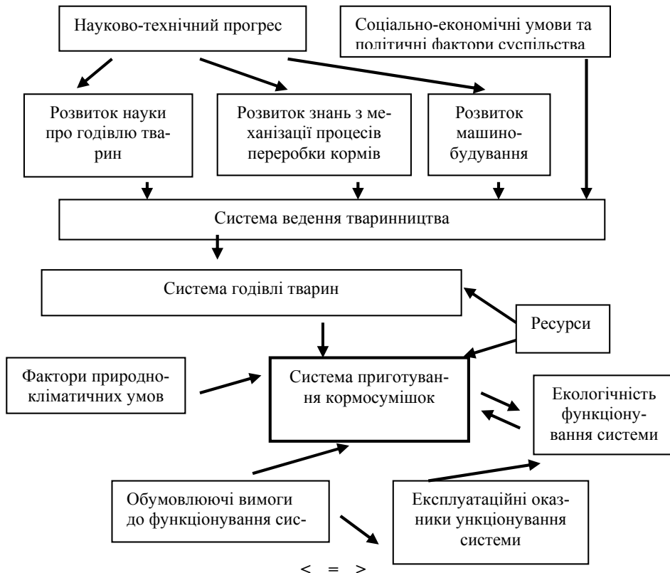
Рис. 1. Ієрархічна структура системи приготування кормосумішок

ки кормових компонентів та їх змішування у складі потокових технологічних ліній. Тобто, в історичному змісті досліджувана підсистема має чітко виражені обмеження як у просторі системи годівлі, так і у часі її функціонування, оскільки система годівлі, сягає своїми коренями в далеке минуле – започаткування утримання тварин у відокремлених від природного середовища умовах.