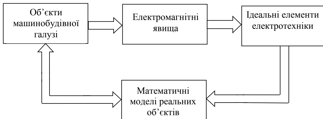
Рис. 2. Концепція формування змісту та методики викладання «Електротехніки»

Така послідовність формування змісту дисципліни в дещо спрощеному вигляді представлена на рис. 2.