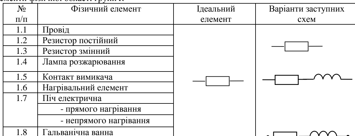
Елементи фізичної області групи R