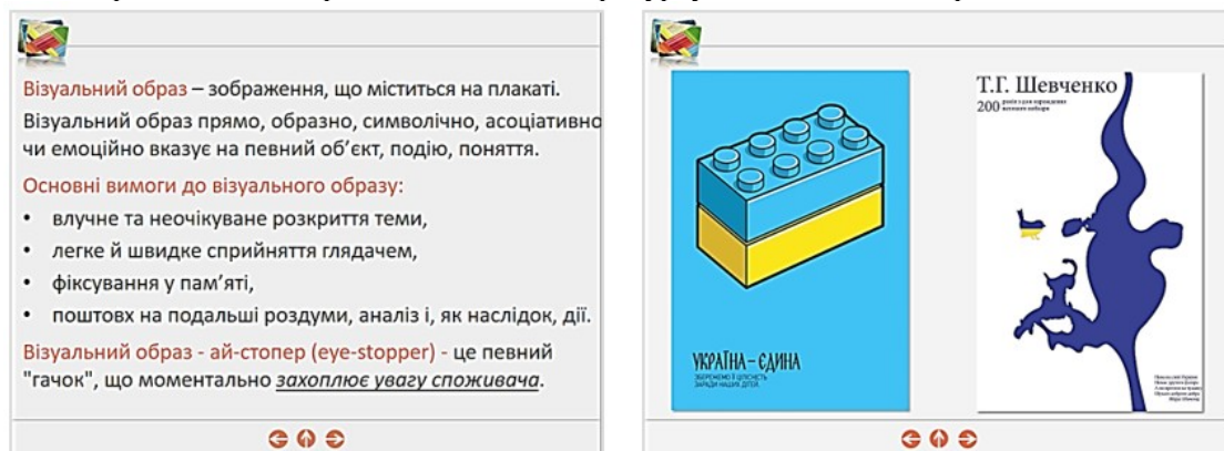
Рис. 2. Фрагменти електронного освітнього ресурсу з елементами патріотичного виховання

Інший приклад використання виховного потенціалу дисципліни «Видавничий дизайн» із метою патріотичного виховання студентів. При розкритті питання «Елементи книжкового комплексу» в електронному освітньому ресурсі поряд із зразками світової поліграфії можна представити приклади оформлення української книги, показавши студентам, що вітчизняні книги минулого і сьогодення – це унікальні взірці друкованих видань (рис. 3).