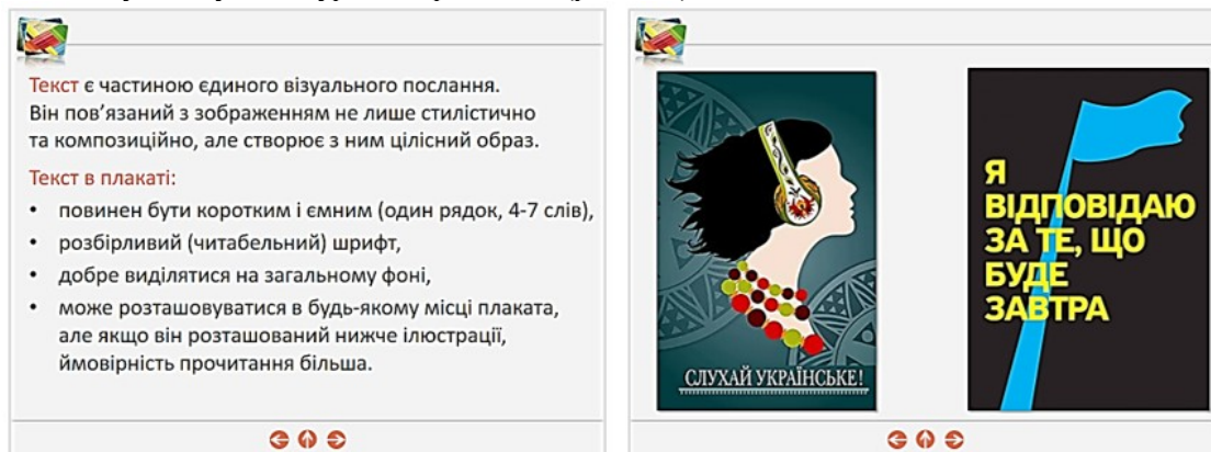
Рис. 1. Фрагменти електронного освітнього ресурсу з елементами патріотичного виховання

Розглянемо приклади, що демонструють цю позицію. Так, при розгляді теми «Плакат», в електронному посібнику можна навести велику кількість прикладів вітчизняних плакатів, які не лише допоможуть розкрити питання заняття і наочно підкріпити текстовий матеріал, а й побічно продемонструють студентам красу і велич Батьківщини, пробудять любов до рідної мови, спонукатимуть до турботи про землю (рис. 1, 2).