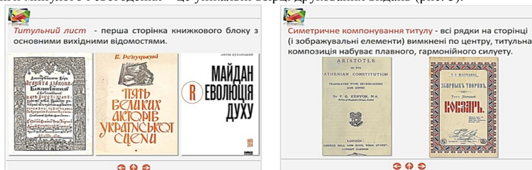
Рис. 3. Фрагменти електронного освітнього ресурсу з елементами патріотичного виховання

Інший приклад використання виховного потенціалу дисципліни «Видавничий дизайн» із метою патріотичного виховання студентів. При розкритті питання «Елементи книжкового комплексу» в електронному освітньому ресурсі поряд із зразками світової поліграфії можна представити приклади оформлення української книги, показавши студентам, що вітчизняні книги минулого і сьогодення – це унікальні взірці друкованих видань (рис. 3).