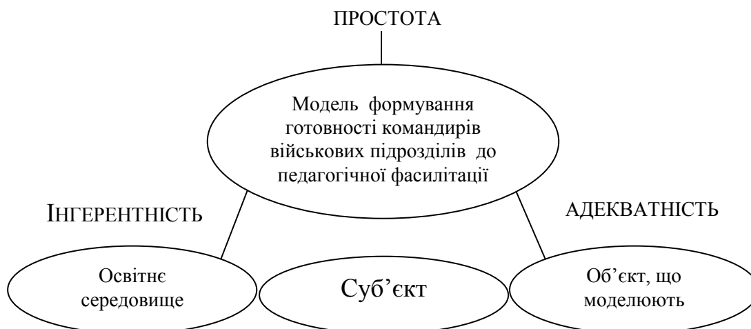
Рис. 1. Вимоги, що пред'являються до моделі формування готовності командирів військових підрозділів до педагогічної фасилітації (за В. Волковою [1])