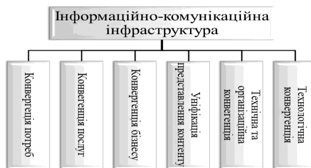
Рис.3. Будова інформаційно-комунікаційної інфраструктури

правових та нормативних механізмів, що забезпечують управління інфраструктурою, її ефективне функціонування та надання інформаційних та комунікаційних послуг користувачам. Призначенням національної інформаційно-комунікаційної структури України є формування єдиного інформаційного простору для вирішення проблем соціального захисту, медичного обслуговування, підвищення якості освіти, забезпечення потреб державного управління, правопорядку, оборони країни та національної безпеки; забезпечення суб'єктів інформаційного суспільства якісними інформаційними та комунікаційними послугами; забезпечення інтеграції національної інформаційно-комунікаційної інфраструктури із глобальною [5]. Сучасні тенденції у сфері інформаційно-комунікаційних технологій зумовлюють будову інформаційно-комунікаційної інфраструктури (Рис.3).