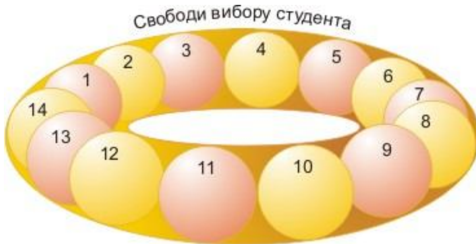
Рис. 1. Реалізація свободи вибору студентом основних положень за індивідуально орієнтованою системою навчання:

ня. Д. Ельконін дав таке визначення навчальної діяльності: “Навчальна діяльність є, насамперед, така діяльність, у результаті якої відбуваються зміни в самому студентові. Це діяльність самозміни, її продуктом є ті зрушення, що відбулися у ході її виконання в самому суб’єкті” [14, с. 45]. Це визначення найбільш вдало тлумачить поняття “навчальна діяльність” і при цьому дуже точно вказує на те, що продуктом цієї діяльності й буде особистісний розвиток майбутнього фахівця.