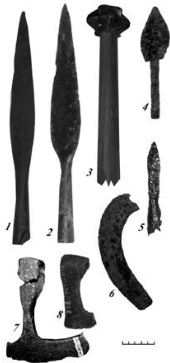
Фото 2. Знахідки предметів озброєння

На території Сірет-Дністровського межиріччя знайдені вузьколисті втульчати наконечники списів, в основному подовжено-трикутної форми. Відомі вони серед знахідок на слов'яно-руських поселеннях у Бузовиці, Ванчиківцях, Черепківцях 47 (рис. 1, 6; фото 2, 1-2).