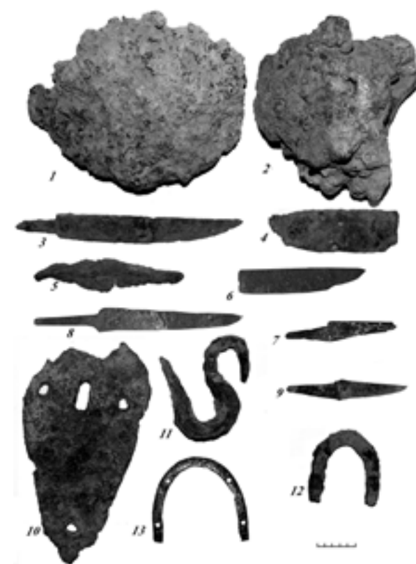
Фото 1. Знахідки побутових виробів

У другій половині XIII – XIV ст. на теренах Західної Європи в зв’язку з еволюцією захисних обладунків ратників, а саме появою пластинчастих обладунків, поширюється новий вид зброї – арбалет. Така зброя була потужнішою, а її стріли-болти могли пробивати пластинчасті панцири. В основному арбалети призначалися для ведення облогової та фортечної війни 41 .