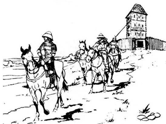
Рис. 2. Виїзд князівського урядника на чолі озброєного ескорту із замку (реконструкція А. Клейна).