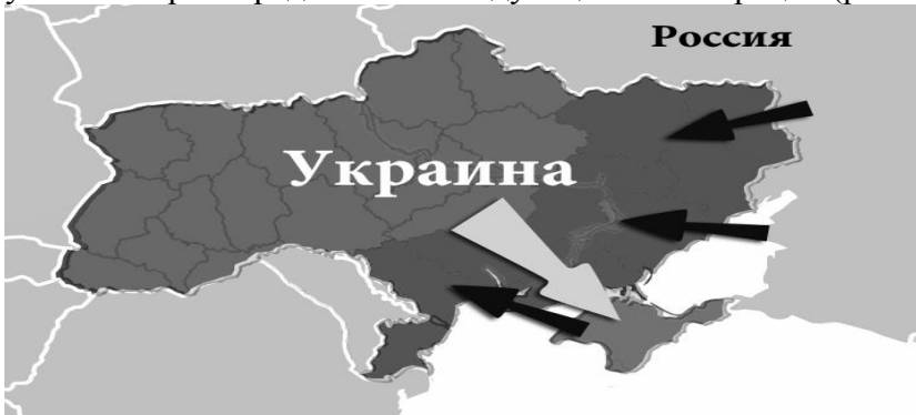
Рис. 6. Реализация ответных действий России при силовом варианте возвращения территории Крыма в состав Украины

4) Если Украина на данном этапе хочет сохранить свою территорию, правящей элите и народу нужно направить свои силы на внутригосударственные, во-первых, экономические, а во вторых, политические преобразования. Если же Украина попытается полномасштабными военными действиями, при полной мобилизации населения, вернуть с помощью силы отобранные территории, это ввергнет страну в колоссальный кризис. В таком случае Россия будет вынуждена защищать уже, так сказать, свою территорию, которая, по сути, принадлежит Украине. И поскольку результат современных военных действий зависит не столько от численности армии, сколько от технологичности военного оснащения, Украина не сможет противостоять российской армии на территории уже Одесской, Харьковской и других Юго-восточных областей Украины. Поэтому попытки силой вернуть территории спровоцируют Россию к военным действиям, благодаря которым Россия будет иметь возможность контролировать территории от Молдовы до Грузии. Автором предлагается следующая иллюстрация (рис. 6).