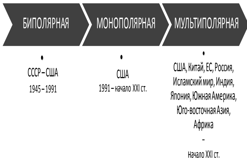
Рис. 2. Трансформация системы международных отношений с 1945 г. до начала XXI ст.

поддержанию мира и безопасности осталась все той же, послевоенной.