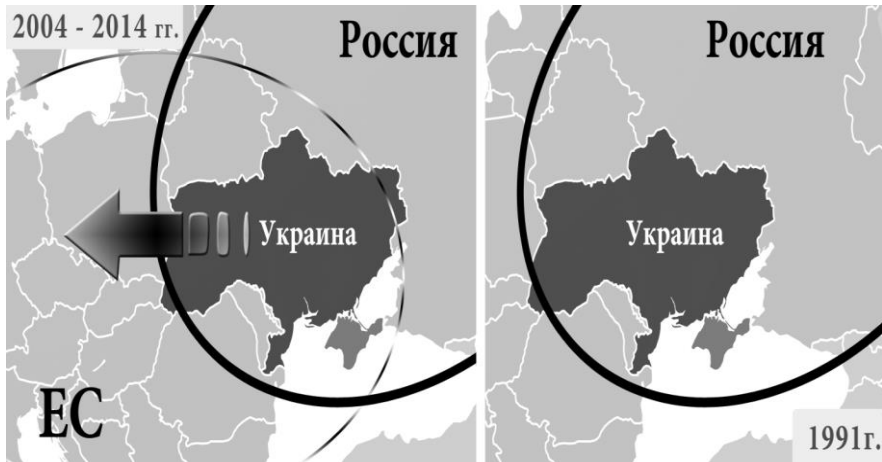
Рис. 5. Региональная переориентация Украины

поддержал проевропейскую направленность украинского народа и выразил желание о вступлении Украины в НАТО 32 .