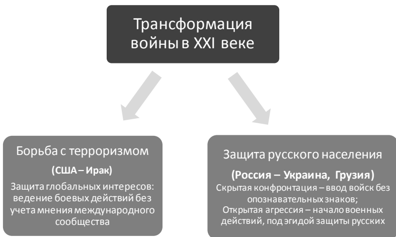
Рис. 3. Новая форма идеологии ведения боевых действий в XXI ст.

Так же, как американская борьба с терроризмом, российская защита россиян в других странах является новым трансформированным методом ведения открытой и явной войны против другого государства. Автором предлагается рассмотреть следующую иллюстрацию (рис. 3).